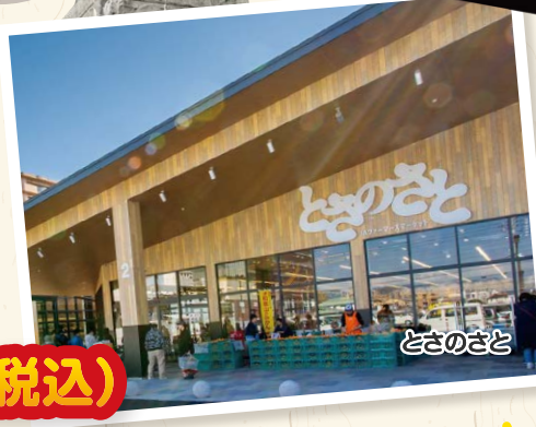
ファーマーズ マーケットでお買い物