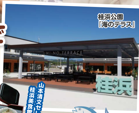
桂浜公園 『海のテラス』