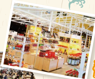
お土産も たっぷり