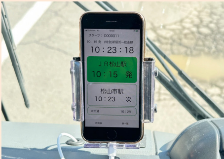
バスの位置情報は iPhone を使用