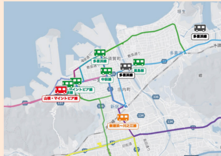
バスの遅延状況が一目でわかる 色表示