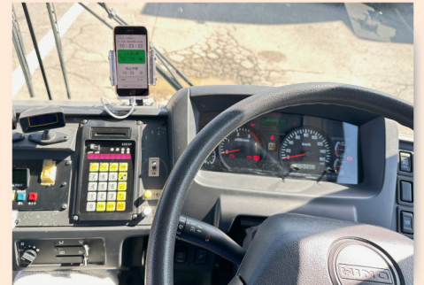
運転士の負担を軽減する 運転士向けアプリ