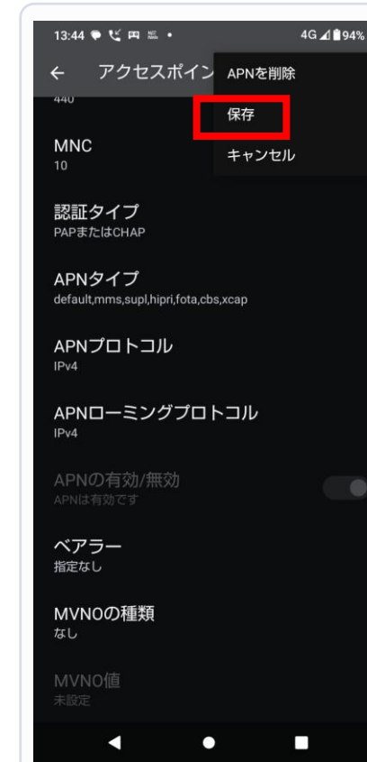
8. 右上メニューから保存