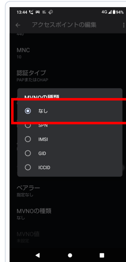
7. MVNOの種類を「なし」に変更